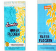
Mühle Gehrsitz Redesign: vorher / nachher

märz punkt umweltorientierte designagentur ► www.merzpunkt.de