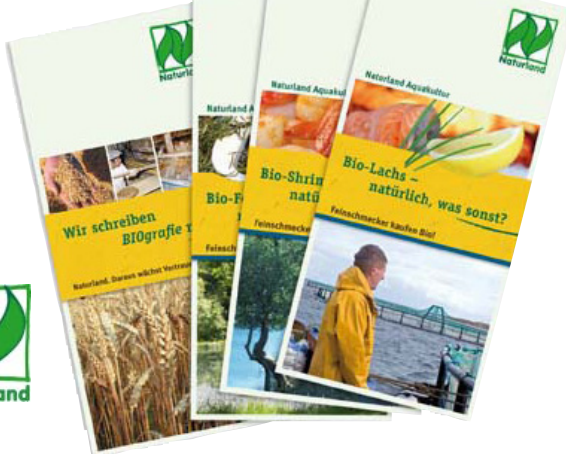
Redesign Gesamtauftritt Naturland

Praktikanten wurden übernommen. Wir arbeiten voller Lust und Spaß miteinander. Bei uns wird viel gelacht – und fast jeden Mittag wird BIO miteinander gegessen.