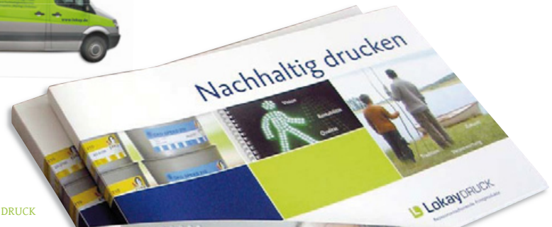
Gesamtauftritt Lokay DRUCK